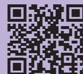
Text und Layout: Thomas Steinecke